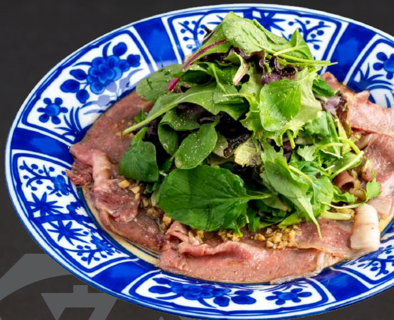
九州産 黒毛和牛 焼きしゃぶサラダ