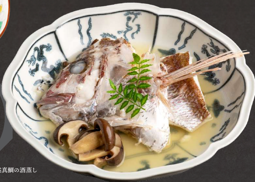
玄界灘 天然真鯛の酒蒸し