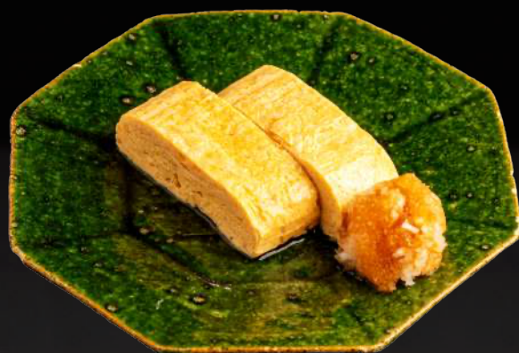
うお田の出汁巻き玉子(ハーフ)