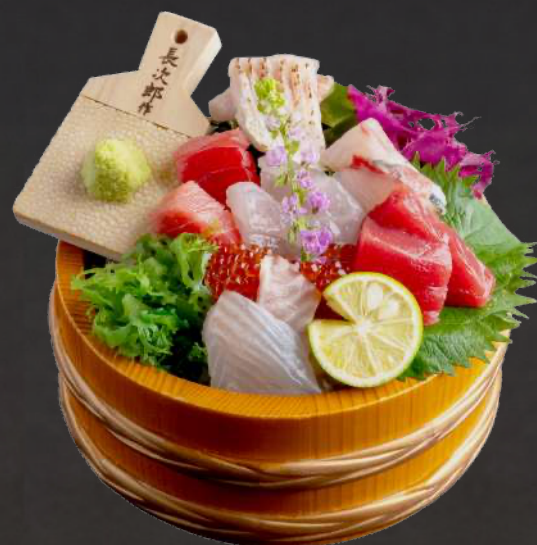
お刺身 桶盛り(1~2人前)