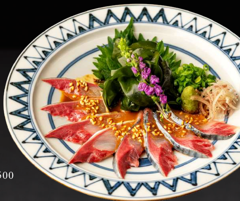
博多郷土料理 ごまさば