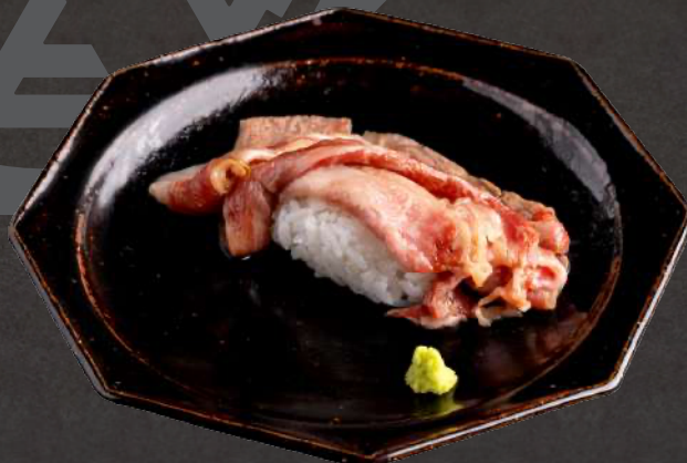
九州産 黒毛和牛の肉寿司