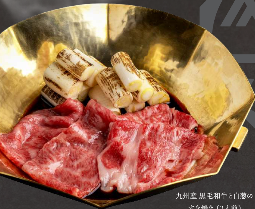
九州産 黒毛和牛と白葱の すき焼き (2人前)