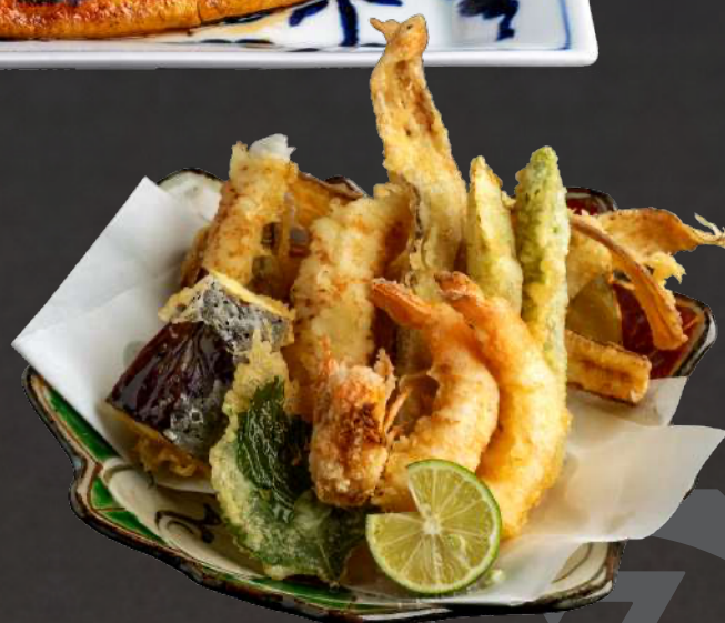
天ぷら盛り合わせ

九州産 若鶏の唐揚げ (4個) ..... 1,000 (2個) ..... 500