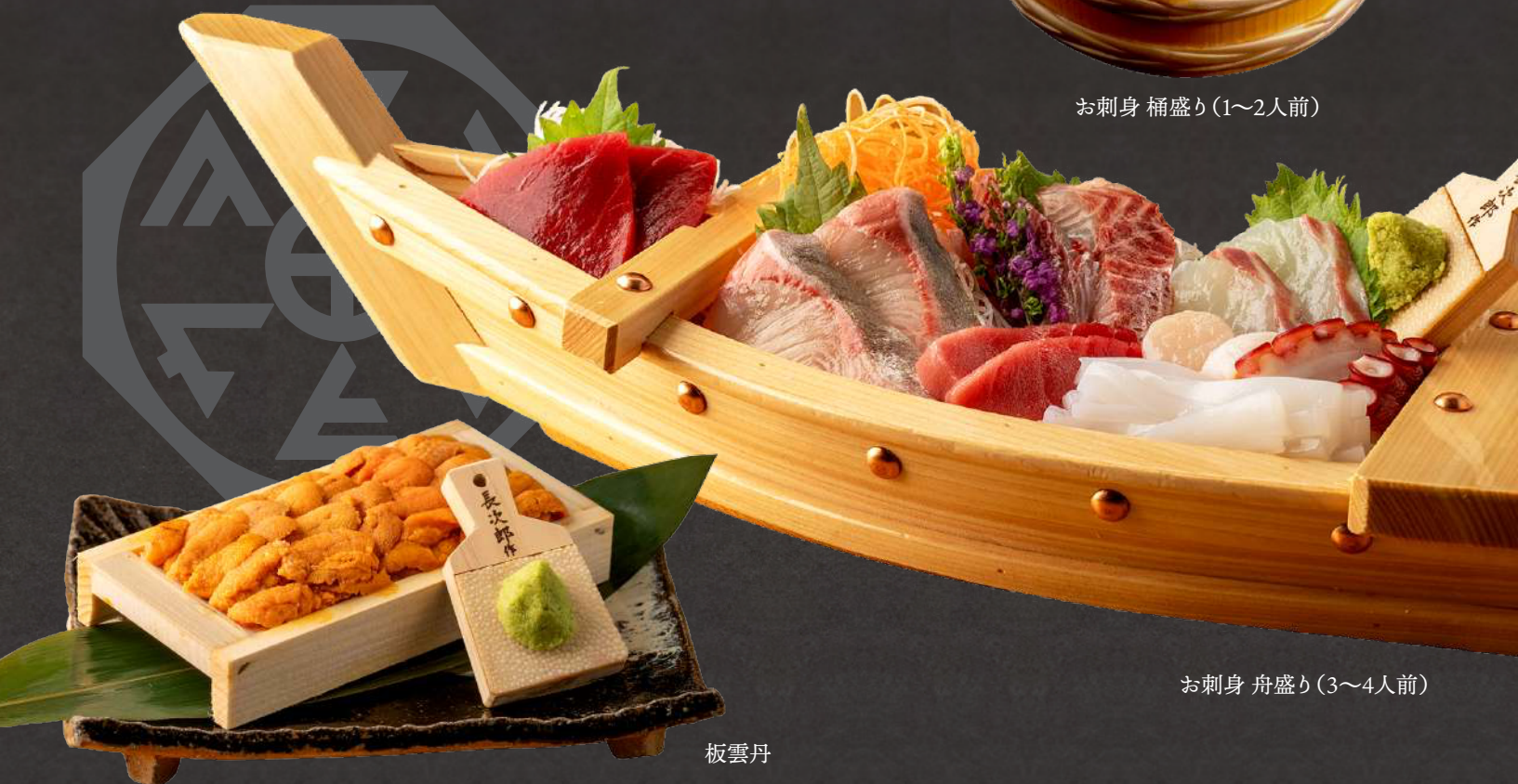
お刺身 舟盛り(3~4人前)