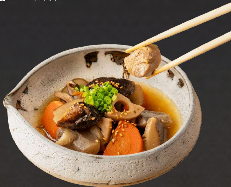
博多郷土料理 がめ煮