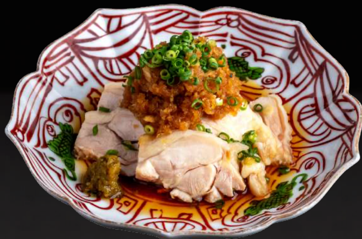
九州産 蒸し鶏のおろしぼん酢 柚子胡椒添え