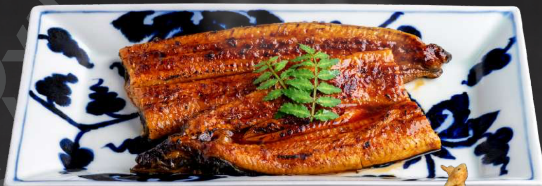
九州産 うなぎの蒲焼き (特上:1匹)